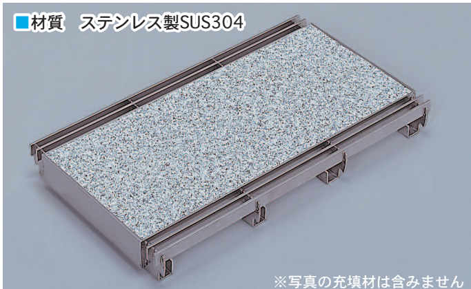
※写真の充填材は含みません