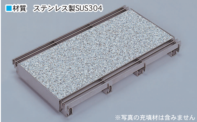
※写真の充填材は含みません