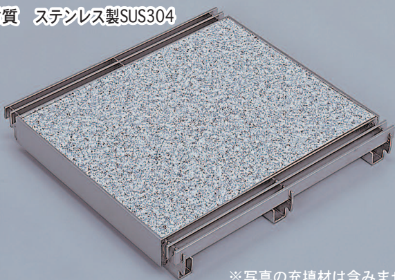
※写真の充填材は含みません