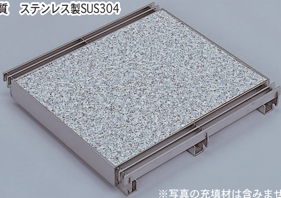
※写真の充填材は含みません