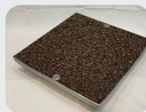
金属製(SS.SUS)フレームを採用 安定した強度を確保しています